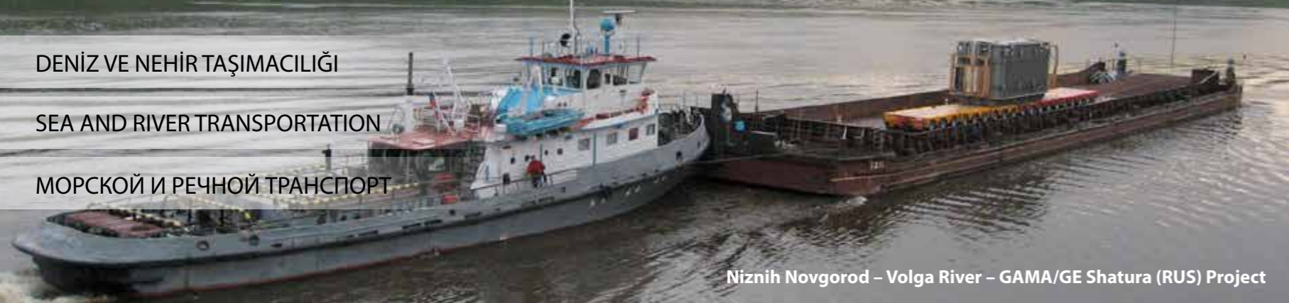
Niznih Novgorod – Volga River – GAMA/GE Shatura (RUS) Project