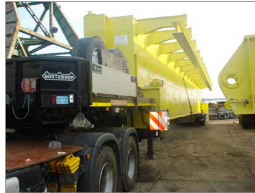
Pervo Uralsk / GAMA Endüstri / PNTZ Steel / Girder 33 Mt. / 60 Tons