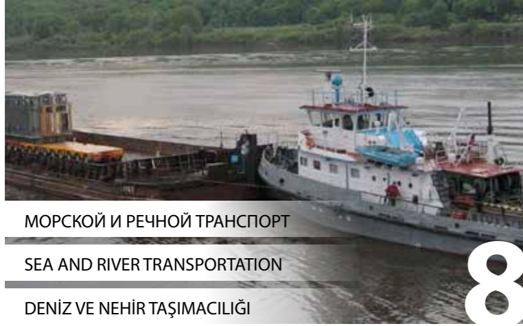
МОРСКОЙ И РЕЧНОЙ ТРАНСПОРТ SEA AND RIVER TRANSPORTATION DENİZ VE NEHİR TAŞIMACILIĞI