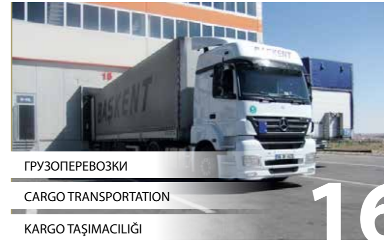
ГРУЗОПЕРЕВОЗКИ CARGO TRANSPORTATION KARGO TAŞIMACILIĞI