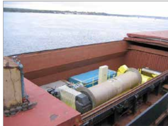
Perm – GAMA Pervouralsky (RUS) Project