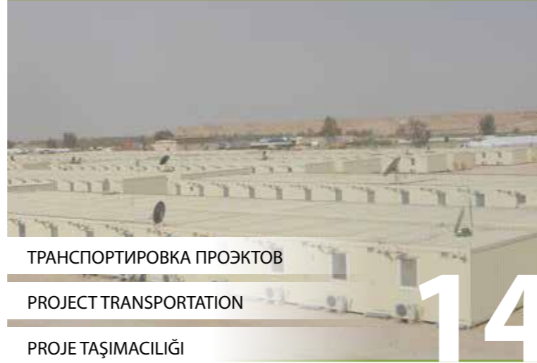
ТРАНСПОРТИРОВКА ПРОЭКТОВ PROJECT TRANSPORTATION PROJE TAŞIMACILIĞI