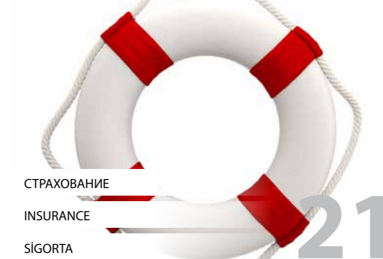
СТРАХОВАНИЕ INSURANCE SİGORTA