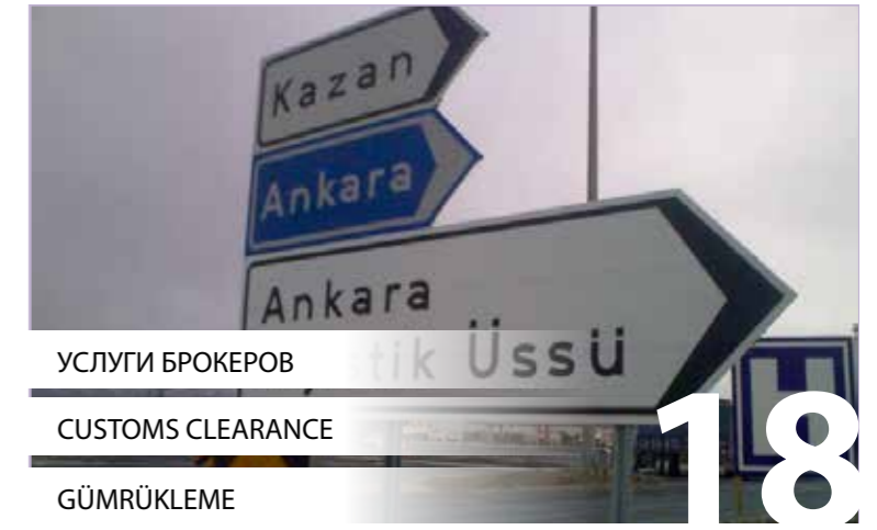
УСЛУГИ БРОКЕРОВ CUSTOMS CLEARANCE GÜMRÜKLEME