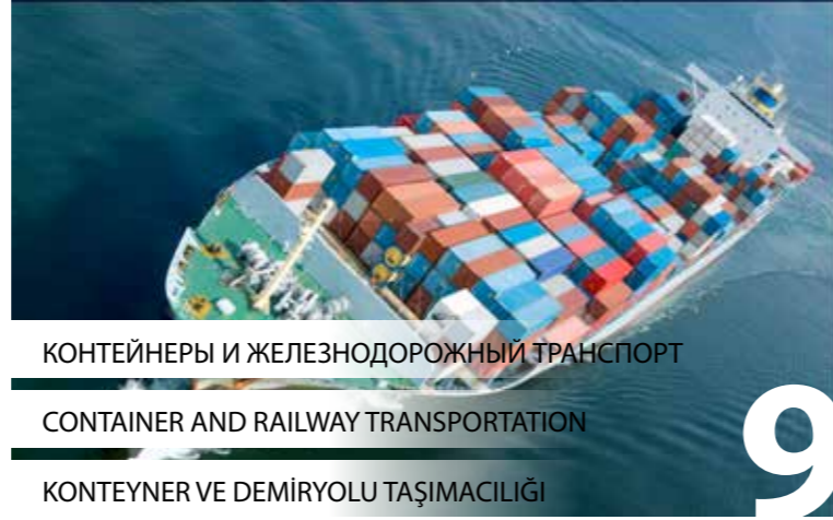
КОНТЕЙНЕРЫ И ЖЕЛЕЗНОДОРОЖНЫЙ ТРАНСПОРТ CONTAINER AND RAILWAY TRANSPORTATION KONTEYNER VE DEMİRYOLU TAŞIMACILIĞI