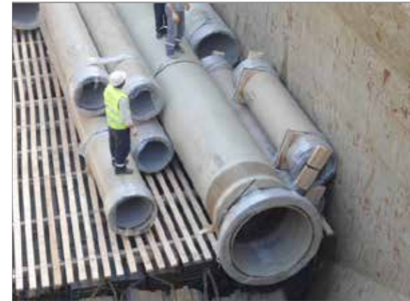
Derince – SUBOR CPT Pipe Project

Through river and channels; transportation is also provided in Russian Federation, Turkmenistan, Kazakhstan, Iran, Azerbaijan and Ukraine.