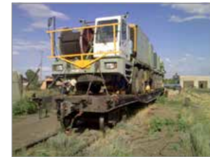
Uralsky –TPIC MR7000 Oil Tower (KZ)

Часто, особенно в связи с узкими автомобильными туннелями, мы используем железнодорожный транспорт для перевозки крупнотоннажных товаров в Казахстан, Россию и страны Балканского полуострова.