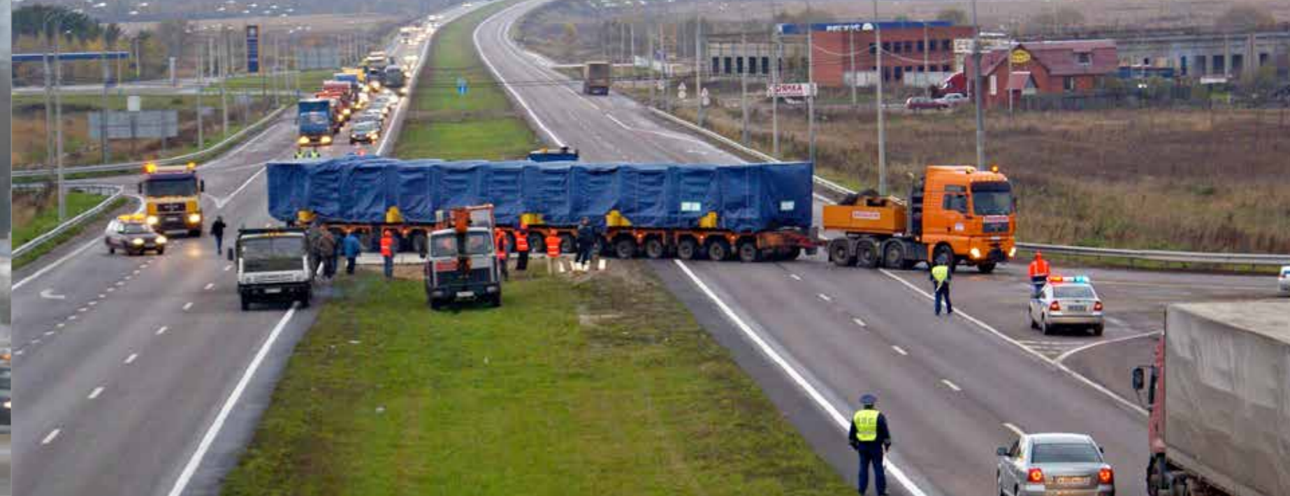
Moscow / MKAT / Controlled Transit Road Crossing / 150 Tons Tube Bundle

Благодаря транспортировке крайне тяжелых материалов, которые являются продукцией, используемой в энергетике и тяжелой промышленности в Российской Федерации, БАШКЕНТ создал себе имя успешного исполнителя таких работ, и очень быстро становится брендом этого направления. Имея большой опыт в работе при перевозке негабаритных материалов БАШКЕНТ при обеспечении строительства порта и дорог, при подъеме и укреплении мостов, осуществлял транспортировку к объекту особо тяжёлых монолитных частей, весом до 450 тонн. Мы осуществляем обеспечение поставок при экспорте, импорте или транзите товаров, являясь альтернативным транспортировщиком всех видов материала, имея в виду и особо тяжелые или негабаритные изделия. При транспортировке тяжелых грузов в стране и за рубежом, мы внимательно проводим анализ перемещаемых грузов, подбирая наиболее подходящее оборудование, укрепляем груз и рассчитываем транспортную безопасность, принимая во внимание условия реализации наших операций.