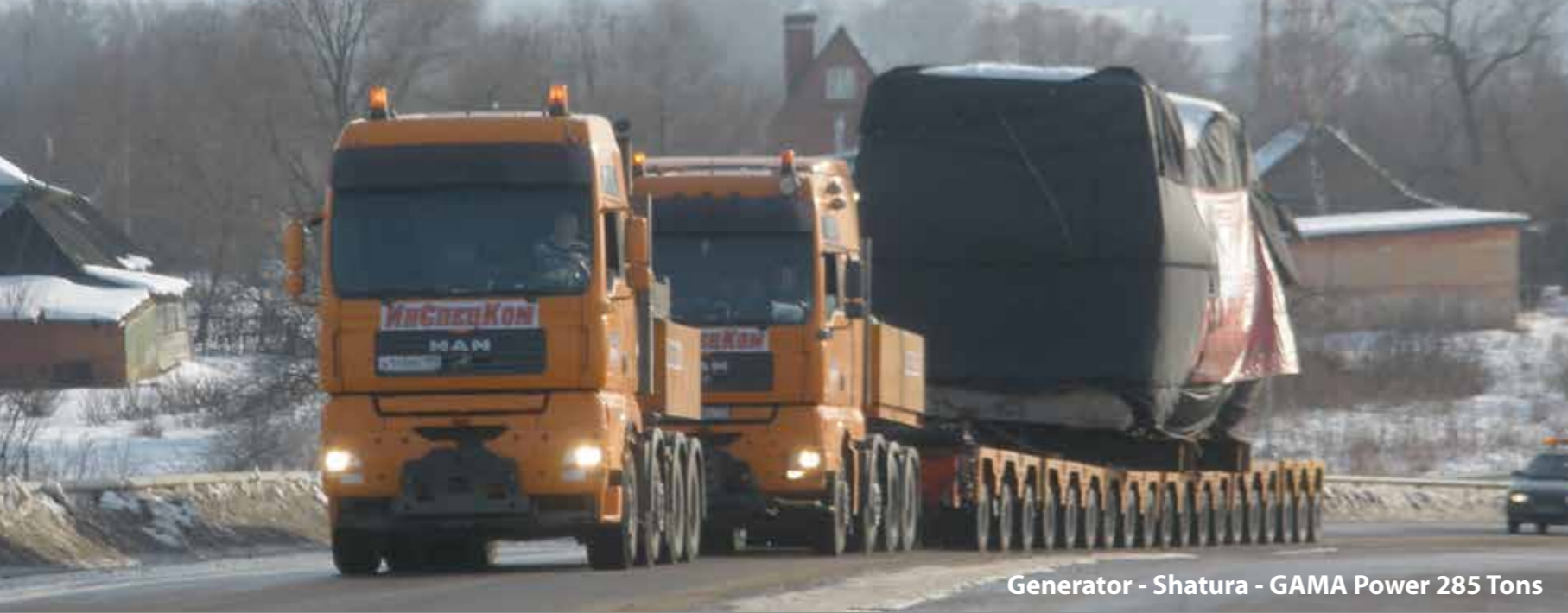
Generator - Shatura - GAMA Power 285 Tons