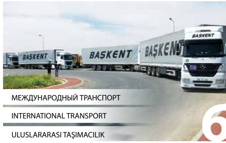
МЕЖДУНАРОДНЫЙ ТРАНСПОРТ INTERNATIONAL TRANSPORT ULUSLARARASI TAŞIMACILIK