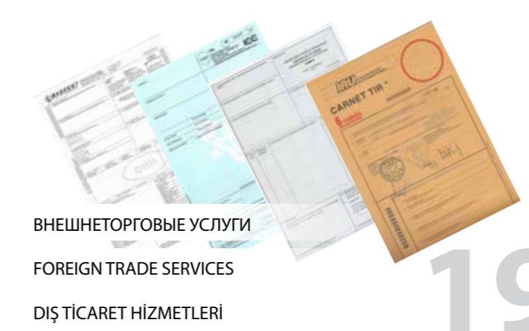
ВНЕШНЕТОРГОВЫЕ УСЛУГИ FOREIGN TRADE SERVICES DIŞ TİCARET HİZMETLERİ