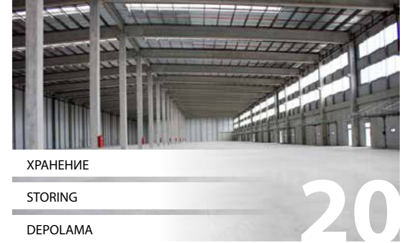
ХРАНЕНИЕ STORING DEPOLAMA