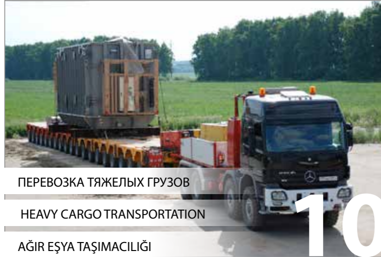
ПЕРЕВОЗКА ТЯЖЕЛЫХ ГРУЗОВ HEAVY CARGO TRANSPORTATION AĞIR EŞYA TAŞIMACILIĞI