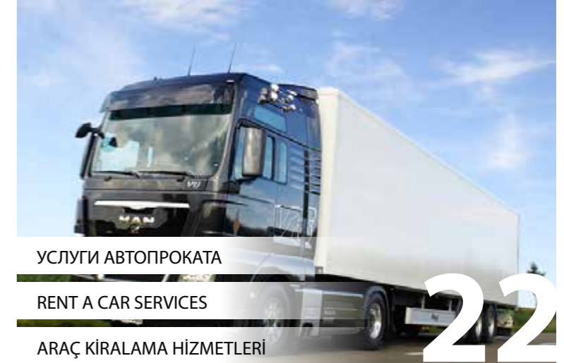
УСЛУГИ АВТОПРОКАТА RENT A CAR SERVICES ARAÇ KİRALAMA HİZMETLERİ